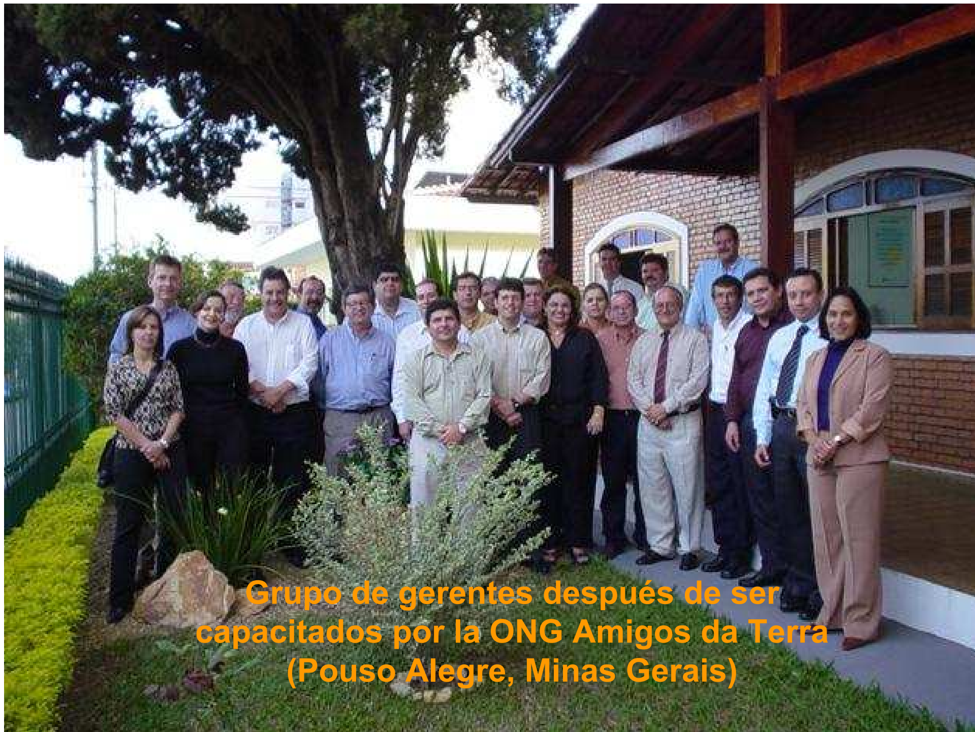
Grupo de gerentes después de ser capacitados por la ONG Amigos da Terra (Pouso Alegre, Minas Gerais)