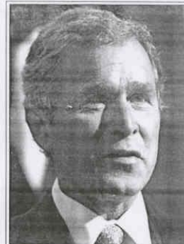
George W. Bush - President of the United States