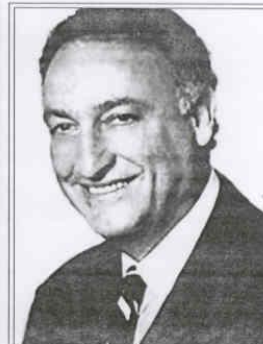
Sandy Weill - Chairman and CEO, Citigroup, Inc.