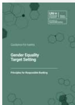
Igualdad de género