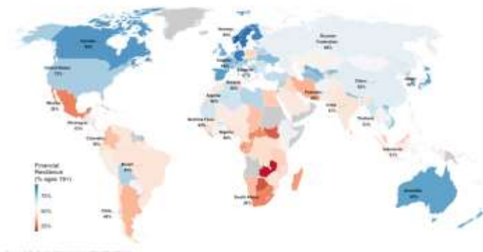
Figure 2. Financial Resilience Worldwide Percent of adults (18+) able to raise 100 of USD per month in 30 days by country, 2017

https://www.unsgsa.org/sites/default/files/resources-files/2021-09/UNSGSA%20Financial-health-introduction-for-policymakers.pdf